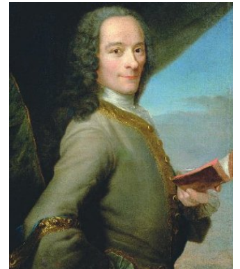
François-Marie Arouet, dit Voltaire (1694-1778)

Quelle est, se demandait-il à lui-même, cette force qui ne peut venir de tous ces tourbillons imaginaires démontrés si faux ? Elle agit sur tous les corps à proportion de leurs masses, et non de leurs surfaces ; elle agirait sur le fruit qui vient de tomber de cet arbre, fût-il élevé de dix mille, trois mille toises. Si cela est, cette force doit agir de l'endroit où est le globe de la Lune jusqu'au centre de la Terre ; s'il est ainsi, ce pouvoir, quel qu'il soit, peut donc être le même que celui qui fait tendre les planètes vers le Soleil, et que celui qui fait graviter les satellites de Jupiter sur Jupiter.